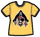
This is a T-shirt