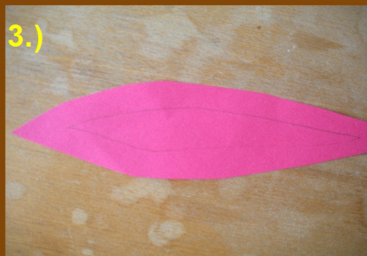
vystřihneme větší část než je velikost otvoru