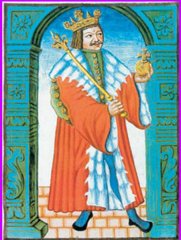
2. Jiří z Poděbrad