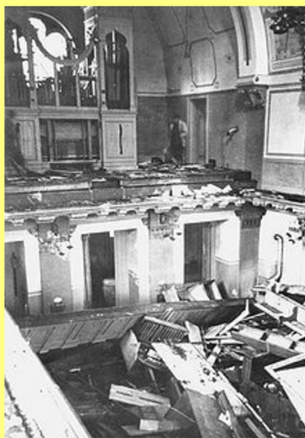
4. Poničená synagoga v Pforzheimu